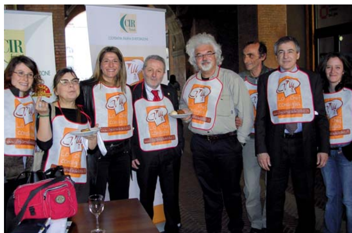
Foto di gruppo dopo la conferenza stampa di presentazione del Giornale del Cibo.