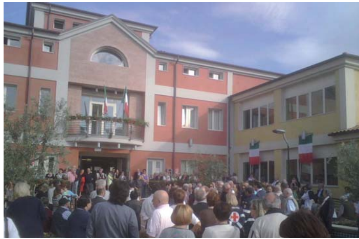
Un momento della manifestazione di inaugurazione della RSA.

Dopo i discorsi delle autorità e del rappresentante dell'ASL di Rimini, l'occasione è stata rallegrata dalla musica tipica romagnola e da un buffet offerto dai commercianti locali.