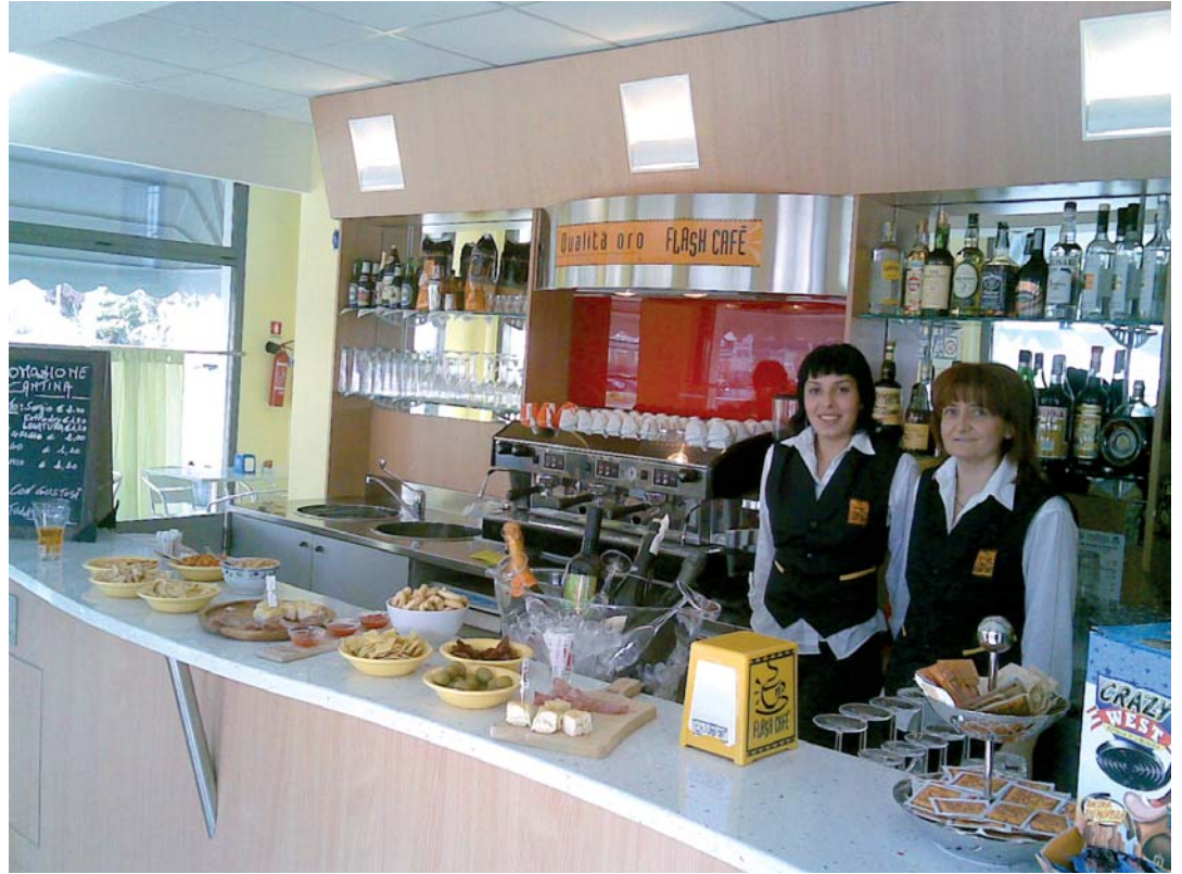
Nella foto il Flash Cafè di San Giorgio Piacentino.