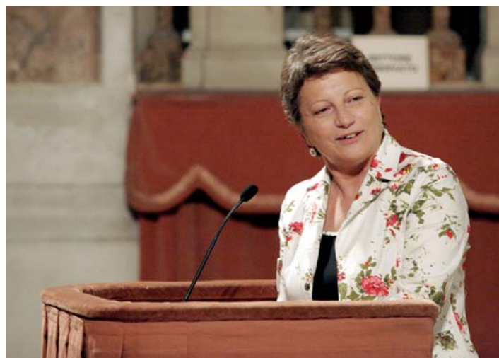
Il sindaco di Mantova, Fiorenza Brioni, intervenuta all'assemblea CIR.

della discussione sul piano strategico, il riposizionamento di CIR food va nella direzione di cedere know-how all'estero, attraverso rapporti di franchising , dopo un periodo caratterizzato anche da gestioni dirette del Gruppo, dai risultati economici altalenanti.