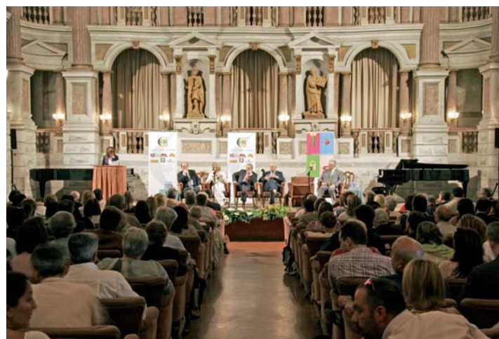
Il tavolo della presidenza.

La presenza di CIR food sui mercati stranieri è stata costruita come un'opportunità per valorizzare la nostra azienda e la sua attività caratteristica. Oggi, dopo una rifocalizzazione dell'analisi nell'ambito