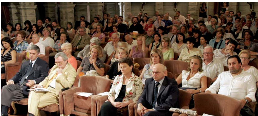
Un'immagine della platea degli intervenuti all'assemblea.

All'inizio del 2007 CIR food si è aggiudicata per 9 anni la gestione dei pasti a degenti e personale dell'Azienda USL di Bologna, che porterà al Gruppo un fatturato annuo a regime di 12 milioni di euro.