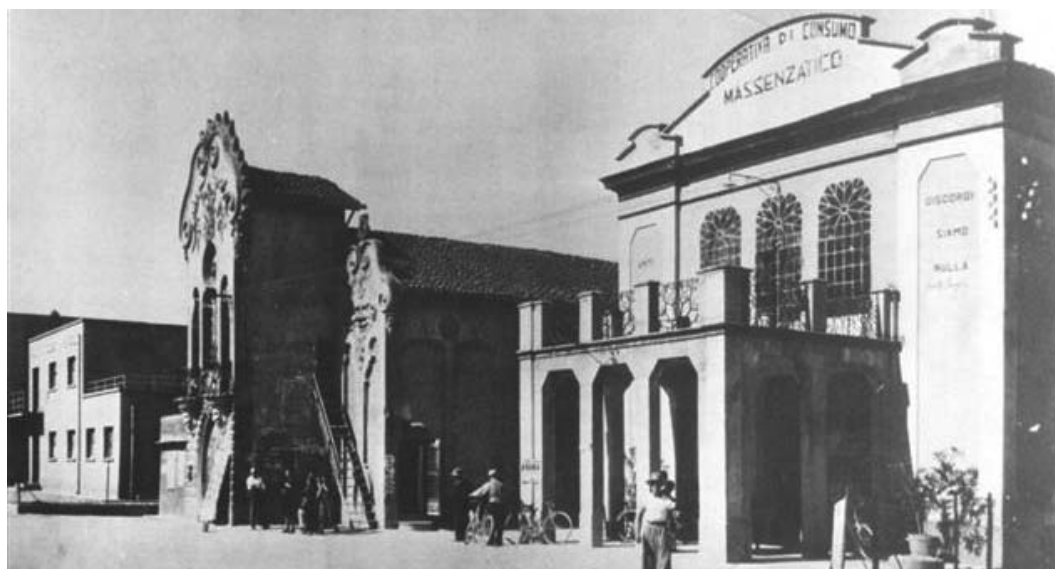
A Massenzatico di Reggio Emilia fu edificata la sede di una delle prime cooperative italiane; sulla facciata la celebre frase di Camillo Prampolini: "Uniti siamo tutto, discordi siamo nulla".

Sette incontri per ricordare, promuovere, consolidare la storia ed i valori della cooperazione