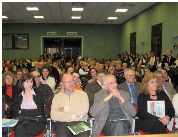
Un momento dell'assemblea dei soci di Reggio Emilia.