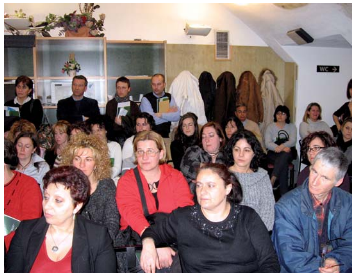
La platea dei soci all'assemblea di Genova.

"Valori e comportamenti che ci hanno fino ad ora premiati, permettendoci di attraversare nella nostra ultra trentennale storia anche momenti sicuramente più difficili degli attuali e con meno mezzi, riuscendo sempre ad ottenere risultati positivi. Giova ricordare ancora una volta che la Cooperativa Italiana Ristorazione, in tutta la sua storia, non ha mai chiuso un esercizio (segue a pag. 4)