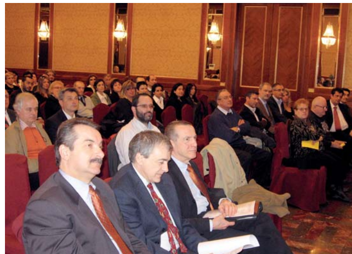
L'assemblea di Milano.

"Oltre al nostro impegno, saranno decisivi per il conseguimento dei punti evidenziati nel piano strategico anche altri aspetti generali, come ad esempio l'andamento della crescita economica in Italia, la lotta all'inflazione, la capacità di spesa dei nostri clienti e non devono essere sottovalutati i possibili effetti negativi dell'attuale situazione politica".